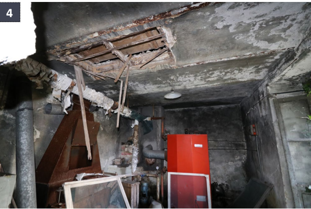
19 maggio 2019