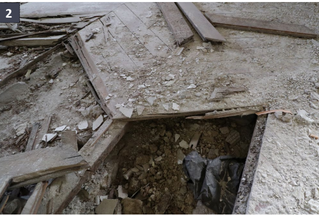
19 aprile 2019