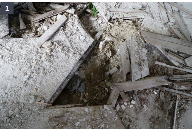
19 aprile 2019