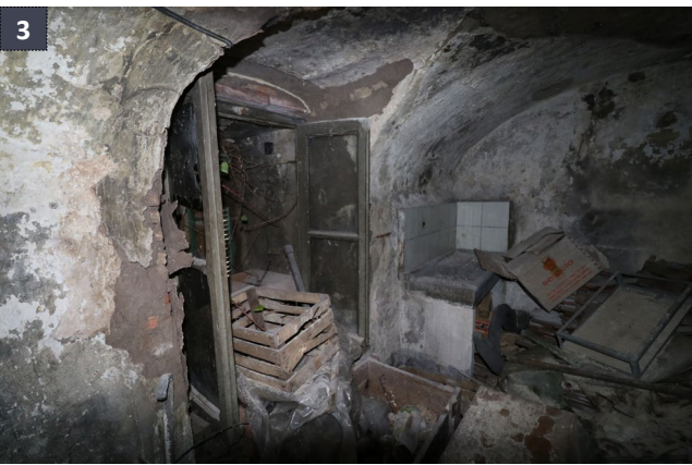
19 maggio 2019