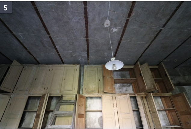
19 maggio 2019